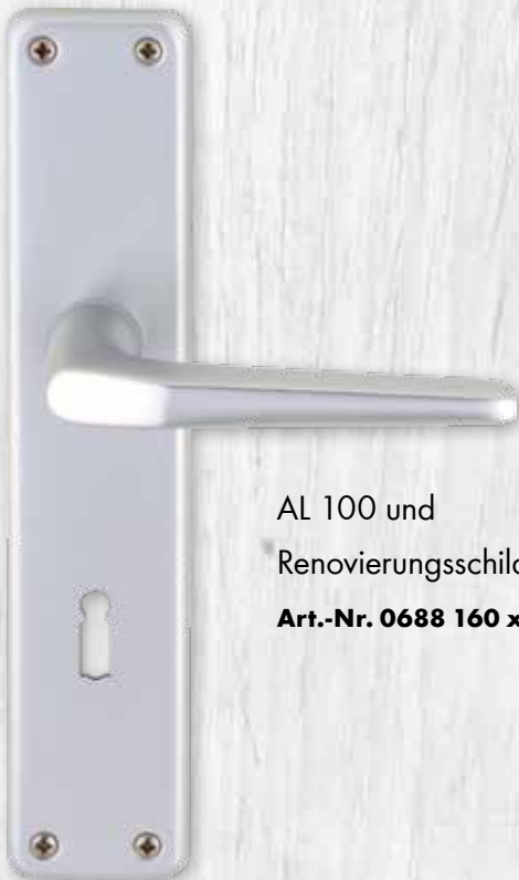
AL 100 und Renovierungsschild AL 90 Art.-Nr. 0688 160 xxx